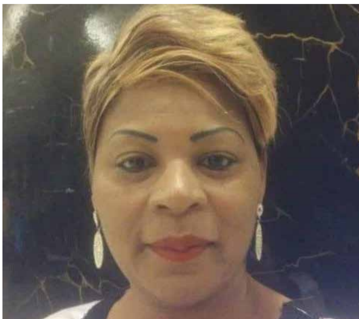
La Dre Justine Laure Menguene, psychiatre, sous directrice de la santé mentale

D istraite, certes, mais d'une détermination sans faille, la Dre Justine Laure Menguene, psychiatre passionnée, a transformé le visage de la santé mentale au Cameroun. En cette Journée internationale des droits des femmes 2026, le groupe média Échos Santé met en lumière cette femme au cœur immense qui a redonné espoir aux personnes atteintes de maladies mentales et aux âmes errantes, offrant une nouvelle dignité à ceux qui en avaient tant besoin. La Dre Laure Menguene est une figure emblématique de la psychiatrie au Cameroun. Son parcours est marqué par une passion inébranlable pour la santé mentale et un dévouement sans faille envers les plus vulnérables. En tant que Sous-directrice de la santé mentale au ministère de la Santé publique, elle est engagée à réduire les souffrances des personnes